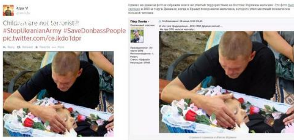
IT'S CRIMEA, 2010

ფოტოგრაფია ძალიან მძლავრი იარაღია, რომ ადამიანი შეცდომაში შეიყვანო. ფოტოგრაფები ხელოვანები არიან, რომლებიც სამყაროს სხვადასხვანაირად გვიჩვენებენ. სწორედ მათზე და ჩვენს აღქმაზე დამოკიდებული, როგორ დავინახავთ ფოტოს და რა მნიშვნელობას დავინახავთ მასში. დიდი ზეგავლენა აქვს იმასაც, თუ რა შინაარსით არის ფოტო წარმოჩენილი. შეიძლება იგი ფაქტობრივად რაიმე დადებით მოვლენას ასახავდეს, მაგრამ როდესაც სოციალური მედია პირდაპირ მიუთითებს ადამიანებს ფოტოების შინაარსზე, ამან შეიძლება შეცდომაში შეიყვანოს ადამიანი და სხვა კონტექსტით დაანახოს იგი. ამისი ნათელი მაგალითია შემდეგი ფოტომანიპულაცია, რომელიც რუსულმა ტროლმა გამოიყენა თავის სასიკეთოდ. რუსული ტროლის მიერ გავრცელდა სოციალურ ქსელში ფოტო, რომლის თანახმადაც ფოტოზე ასახული ბავშვი უკრაინული არმიის მსხვერპლია, რომ დონბასში კრიმინალური რეჟიმის გაბატონებული და დროა დონბასის მაცხოვრებლები დაიცვან უკრაინული არმიის აგრესიისგან, ტრადიციულად თან ახლავს ჰეშთეგი: “savedonbasspeople”. როდესაც ადამიანი შეხედავს ამ ფოტოს, მართლაც შესაძლებელია, რომ გაუჩნდეს განცდა, რომ ბავშვი კრიმინალური რეჟიმის მსხვერპლია, ის მოწყენილია, დარდიანი, ჭუჭყიანი, ტალახში ამოგლანგნულია, რაც ადამიანს აფიქრებინებს, რომ რამე შეემთხვა. სინამდვილეში ეს ბავშვი ძალიან ლაღად, ბედნიერად ცხოვრობს. ის ავსტრალიელია, ძალიან უყვარს თავისი ძალი და ტალახში ამოგლანგლა. სინამდვილეში ეს ფოტო ეკუთვნის ქეთრინ ატკინს, მისმა ფოტომ 2010 წელს ჩრდილოეთ მწყემსთა ასოციაციის